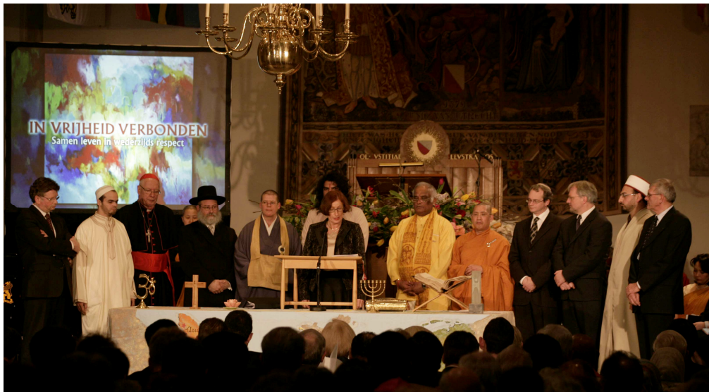
De vertegenwoordigers om de tafel met de symbolen

versele Verklaring van de Rechten van de Mens over godsdienstvrijheid: "Een ieder heeft recht op vrijheid van gedachte, geweten en godsdienst; dit recht omvat tevens de vrijheid om van godsdienst of overtuiging te veranderen, alsmede de vrijheid hetzij alleen, hetzij met anderen zowel in het openbaar als in zijn particuliere leven zijn godsdienst of overtuiging te belijden door het onderwijzen ervan, door de praktische toepassing, door eredienst en de inachtneming van geboden en voorschriften."