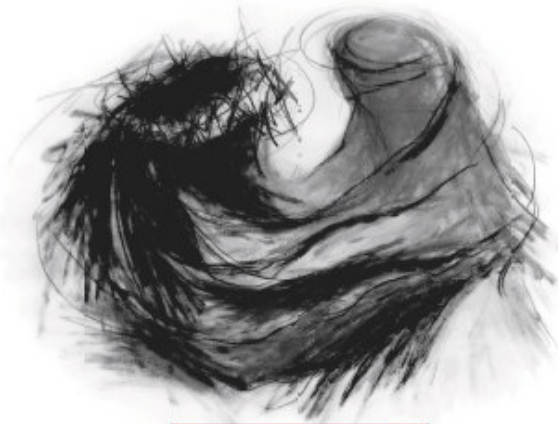
IV - Jezus ontmoet zijn moeder

Op de website www.intercitypasen.nl is materiaal te vinden dat lokale raden van kerken, gemeenten/parochies helpt bij de voorbereiding en de evaluatie, zowel met als zonder gasten. Ook is er catechesemateriaal voor jongeren. Verder is er naast het boekje ook veel ander materiaal beschikbaar: folder, posters, boekenlegger, serie posters met de 11 kruiswegstaties (zie de afbeelding rechtsboven), ansichtkaarten, dvd, en natuurlijke de treinkaartjes waarmee men op symbolische wijze van station naar station, van